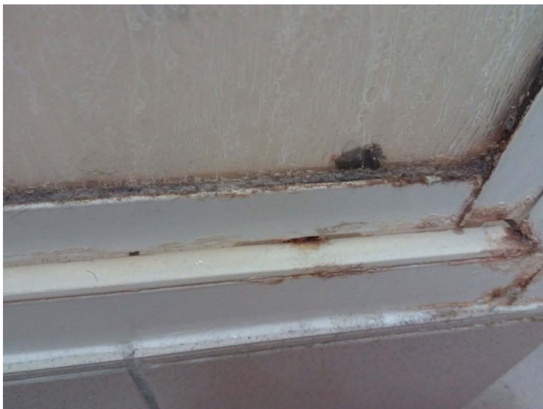
Obrázek 4 Dveře sprchového koutu J. L. Fischera B. 4. patro.