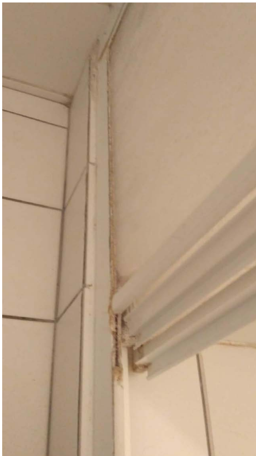
Obrázek 7Dveře od Sprchového koutu - J.L. Fischera B