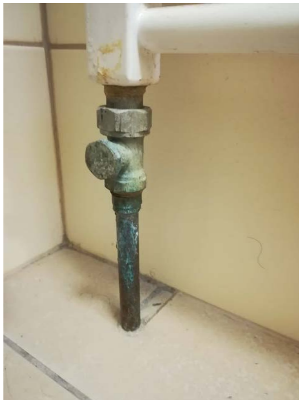
Obrázek 6 Topení v koupelně NII