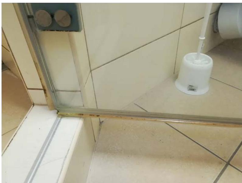
Obrázek 9 Vchod do sprchového koutu NII