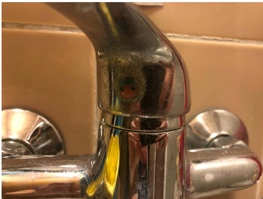
Obrázek 5 Baterie NIII