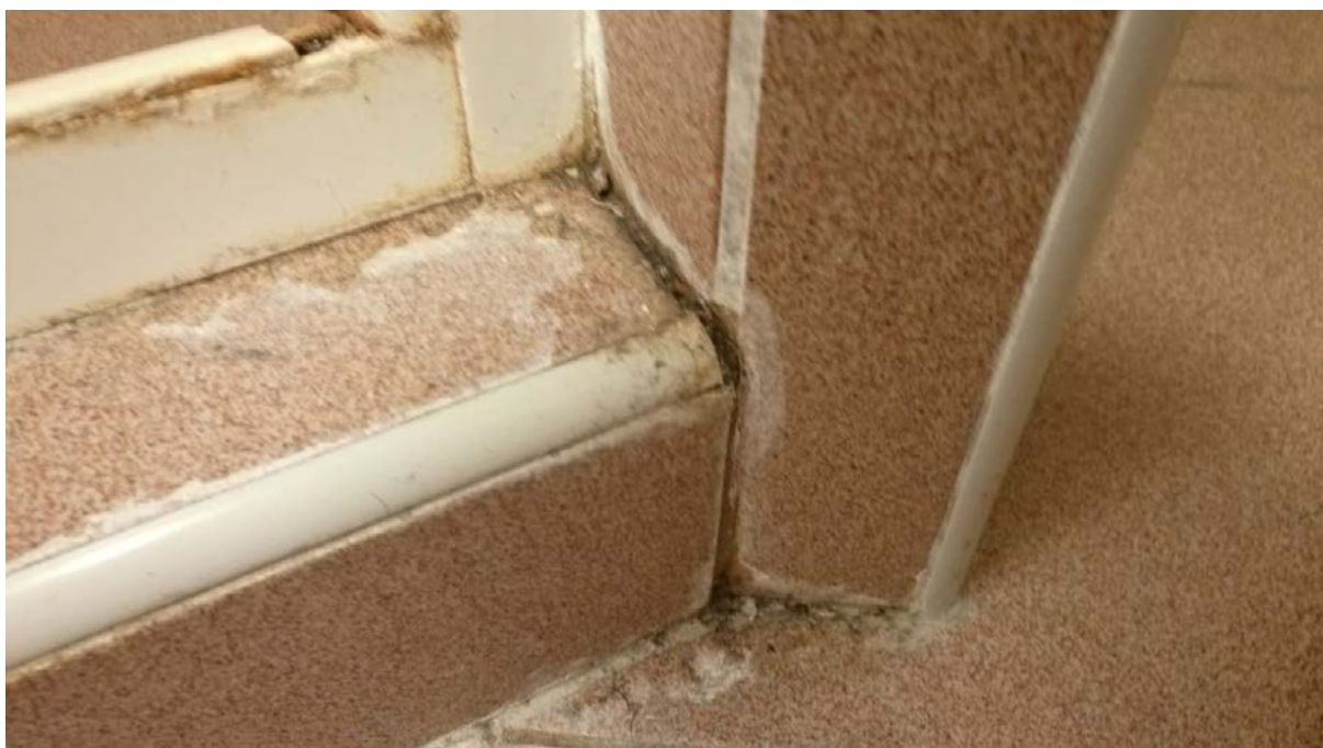
Obrázek 4 Vchod do sprchového koutu NIII