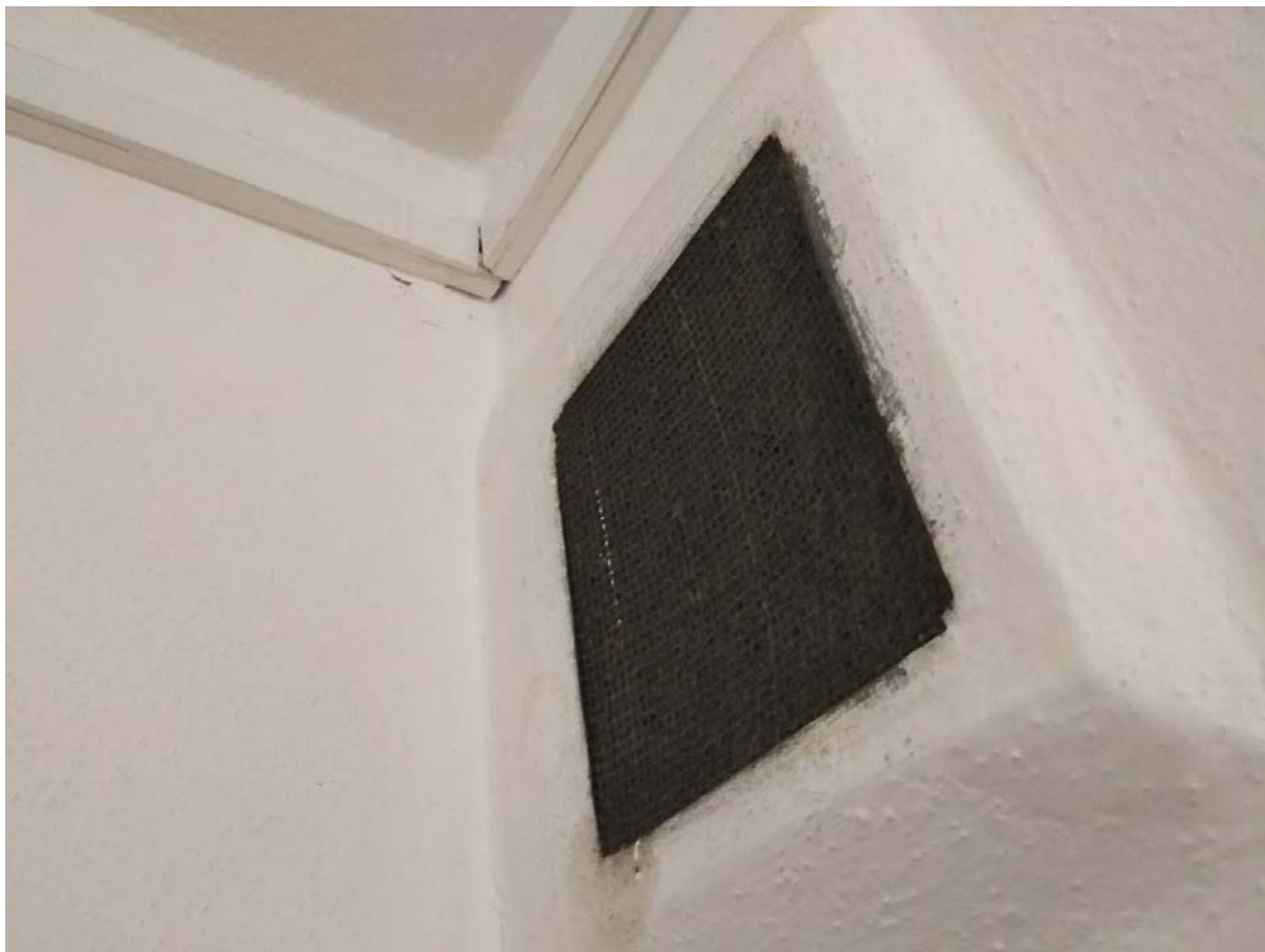
Obrázek 8 Vzduchotechnika kuchyněk J.L Fischera