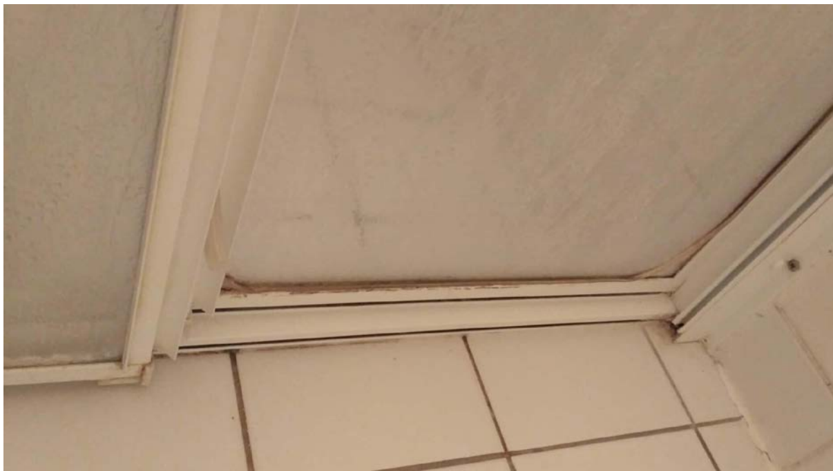
Obrázek 10 Vchod do sprchového koutu – Envelopa