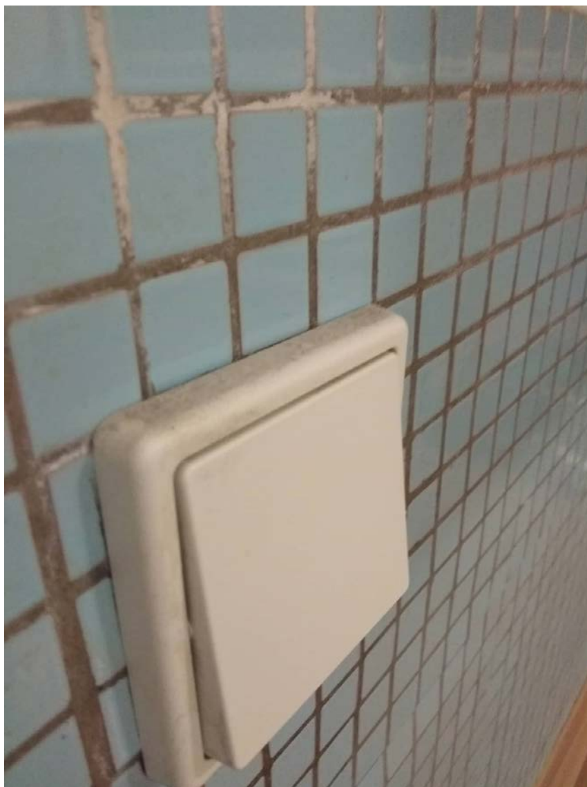
Obrázek 11 Kuchyňka Generála Svobody