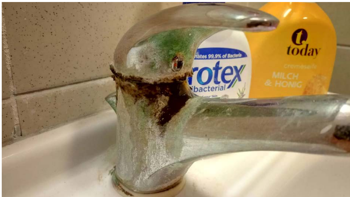
Obrázek 1 Koupelna Neředín III

Obrazová příloha k bodu 4. 2 – generální úklid