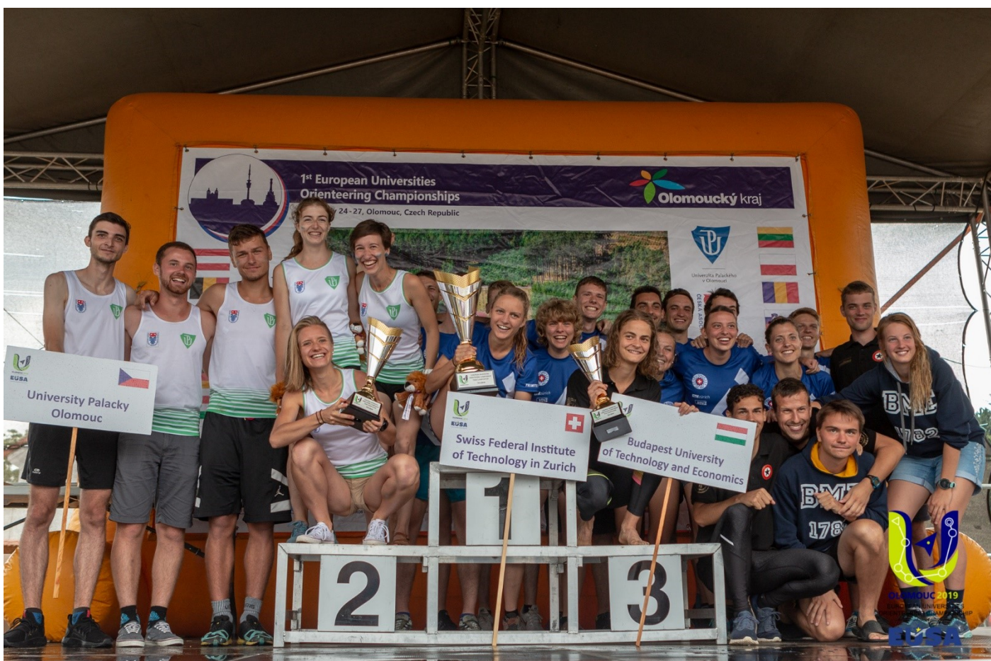
Tým Univerzity Palackého obsadil celkově druhé místo