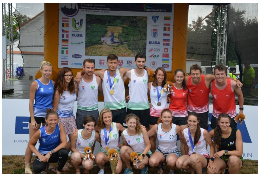
Týmy českých univerzit soutěžily v jednotných dresech

Webové stránky akce najdete zde: http://www.euoc2019.cz/ a zde: https://orienteing2019.eusa.eu/